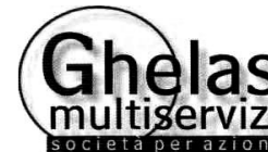
Report mese di maggio 2020