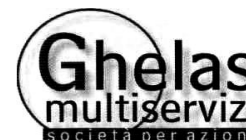
Report mese di maggio 2020