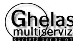
Report mese di maggio 2020