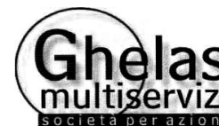
Report mese di Dicembre 2020